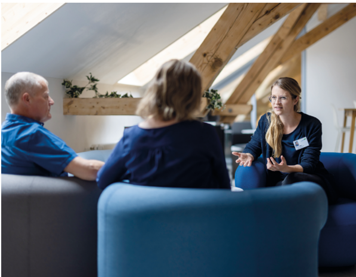
Bild: Professionelle Unterstützung entlastet und schafft neue Perspektiven.