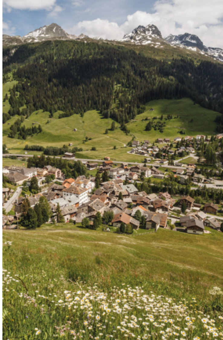
Bild: Splügen, Ort der Generalversammlung 2026